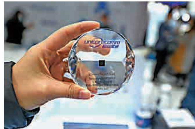
◀中國科技自主研發能力提升，這是和芯星通科技新一代22nm高精度定位芯片，建基於北斗衛星導航系統的最新應用。

事實上，近年中國科技創新發展與突破，為產業發展與經濟增長不斷添加動能。中國科技自立逐步取得成效，包括北斗衛星導航系統開通、量子計算原型機「九章」面世與第三代核電「華龍一號」正式商運等，在在顯示中國自主研發能力提升。在新技術應用下，中國數字經濟規模將繼續快速增長，激發更大產業投資，從而