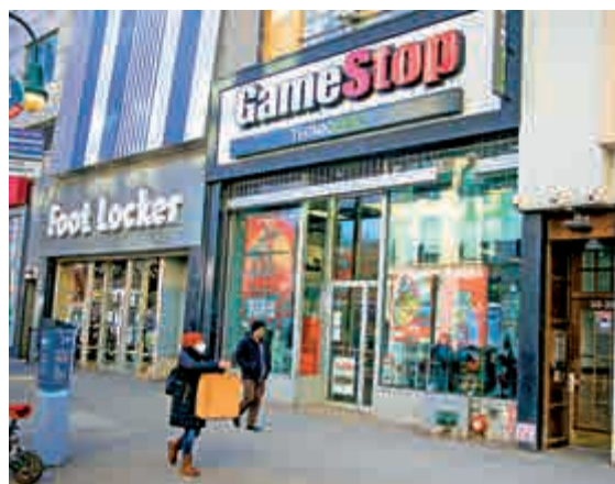
◀GME股份的散戶門戶大戰，不少獲利者都把所賺到的錢捐予當地的慈善基金，幫助有需要的底層人群。