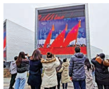
▲上海國際傳媒港超高清大屏同步播放8K超高清電視頻道。網絡圖片

啟動現場播放了由總台英語中心和技術局共同攝製的中國首部全流程8K紀錄片《美麗中國說》。該片在8K技術應用上取得的跨越性突破，奠定了總台在超高清視頻製作的引領地位。