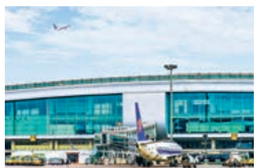
▲廣州空港中央商務區項目位於白雲機場南側，打造灣區臨空標誌性綜合體。

【大公報訊】記者方俊明廣州報道：「廣州空港中央商務區」項目1日動工，總投資約180億元（人民幣，下同），將打造集會議、展覽、商務、酒店、文旅、總部等一體的「粵港澳大灣區臨空標誌性綜合體」，推動廣州「國際航空樞紐」建設。數據顯示，2020年白雲機場不僅旅客吞吐量位居全球第一，空運進出口貨值再創新高，突破2800億元，同比增長21%；而且跨境電商業務貨值已連續7年位居全國空港首位。