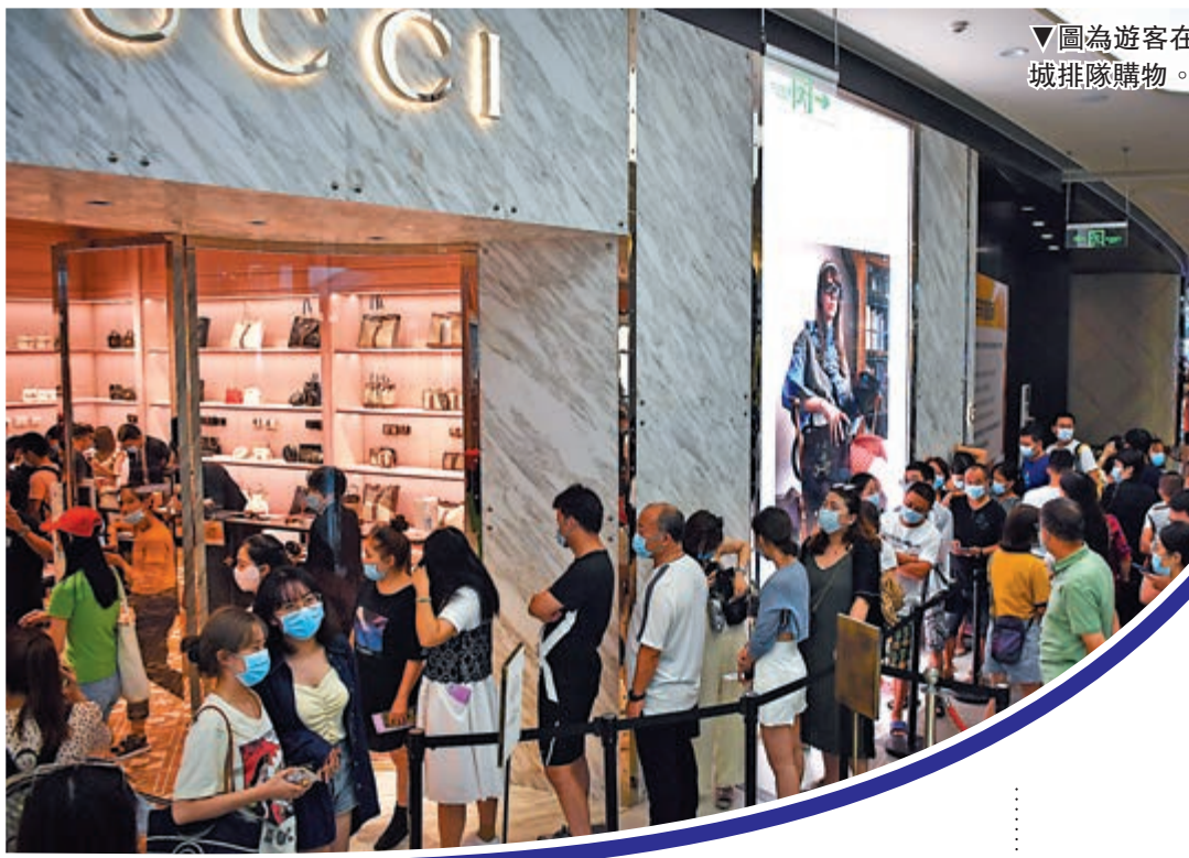
▼圖為遊客在三亞國際免稅城排隊購物。

仲量聯行中國區零售地產部總監陳然相信，中國經濟和消費的持續復甦、增長，將進一步增強各大品牌在今年拓展市場的信心，預計化妝品、服飾、國潮時尚零售、生活方式集合店等品牌延續擴張勢頭。胡潤則指出，目前內地奢侈品消費市場在全球市場佔比約33.33%，預計5年後該佔比有望進一步提升至50%左右。