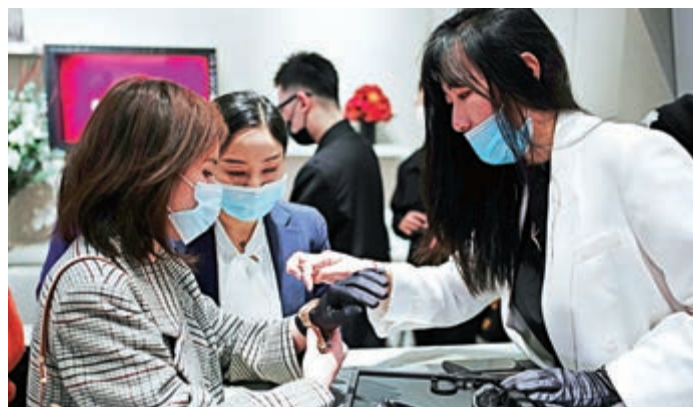
▲去年中國內地首次成為瑞士鐘錶全球最大出口市場。圖為消費者在深洲商場內選購高端手錶。資料圖片