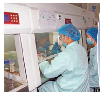
▲「器官芯片」技術融合物理、化學、工程學和生物學等多學科方法。

這種模型系統具有建模周期短、成本低、人源性和易於監測等特點，可以得到傳統方法難以獲取的動態生物學信息，並可延伸用於多器官累及的新冠肺炎機理研究。近日，該研究成果已在國際著名期刊《先進科學》(Advanced Science)發表。