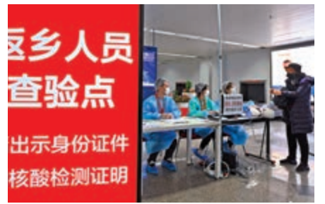
▲在海口美蘭國際機場，返鄉人員抵達後登記信息。

明。一些景區陸續取消了此前的有關規定。例如，此前要求查驗7日內核酸檢測證明的景區中，雲南大理於2月1日下發文件，1月27日的文件作廢。低風險地區人員到大理，不再要求7日內核酸檢測證明，只要有健康碼和行程卡綠碼即可通行。