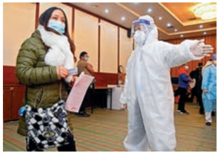
▲近日在北京新冠疫苗接種點，工作人員引導接種人員接種疫苗。

要有專人負責監督受種者將按壓接種部位的棉籤統一廢棄在指定的回收容器內，不得帶離現場，疫苗外包裝盒和疫苗說明書要留存在接種單位。此外，新冠疫苗接種點要加強清潔。