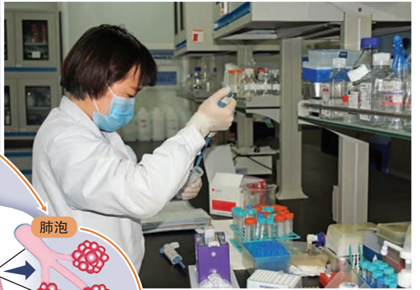
▲「器官芯片」技術可在流控芯片上仿生構建多種人體組織器官的微縮模型。圖為大連幹細胞與精準醫學創新研究院研究人員。