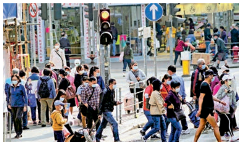
▲现阶段香港疫情反覆，但預期樓市仍會得到支持。

香港部分年輕人對內地產生抗拒，加上疫情影響，拖慢了香港在大灣區的發展步伐。但預期今年疫情能將逐步放緩，兩地人流互動重啟後，大灣區將加速發展，對本港樓價也有正面作用。