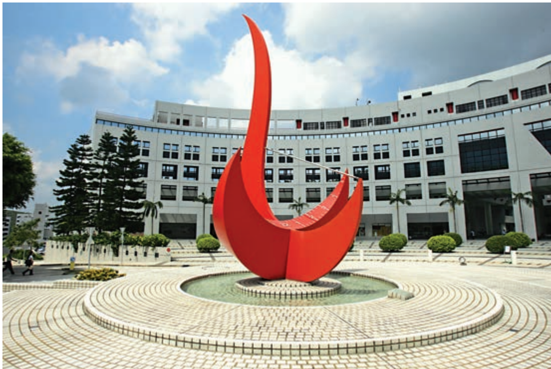
▲香港科技大學借助國家超級計算廣州中心的算力，成功開發新的三維高解析度中國海多尺度海洋環流模型，首次把三層環流的奧秘展現世人面前。