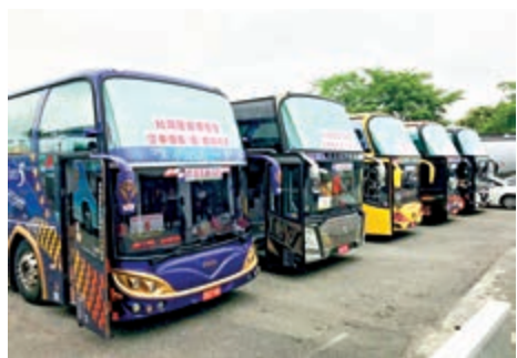
▲由於受疫情影響，島內許多遊覽車都找不到客人。資料圖片

【大公報訊】據中新社報道：台灣當局勞動事務主管部門日前公布的最新統計顯示，受新冠肺炎疫情影響，台灣大多數旅行社每個月給員工放無薪假的時間達15天甚至更長。