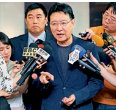
▲趙少康淡出政壇後轉戰媒體，擁有較高的知名度。資料圖片