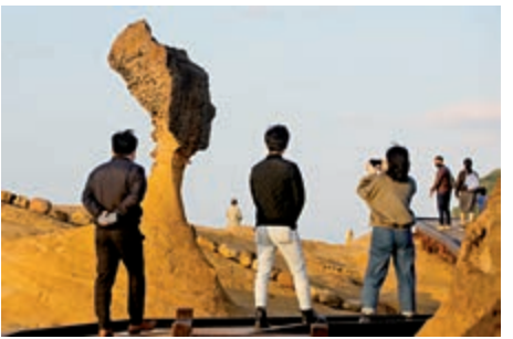
▲台灣疫情升溫，許多景區都實施人流管制。

據《聯合報》報道，多位台灣旅館業者表示，往年正月初二到初四應為客滿的狀態，但目前很多旅館都面臨客戶退訂的情況，同行聚在一起就是苦笑、討論有多少訂單被取消。