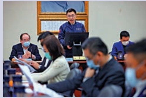
國民黨主席江啟臣將聘任趙少康為中評委。