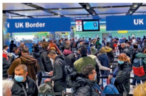
▲1月底，希思羅機場擠滿入境英國的旅客。

自我隔離10日。對於議員質疑，夏國賢僅表示，政府正研究針對自我隔離採取進一步措施。