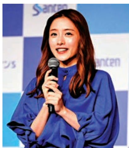
▲日媒爆料演員石原里美確診新冠肺炎。

【大公報訊】綜合日本NEWS post seven、共同社報導：日本新冠疫情未息，知名日劇演員石原里美1月中確診新冠肺炎，但沒有出現病徵。目前她正接受隔離。