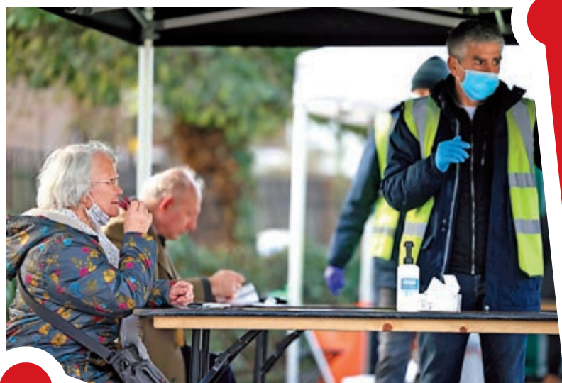
▲倫敦民衆2日進行新冠病毒檢測。

【大公報訊】綜合BBC、路透社、《金融時報》報導：新冠變種病毒去年底起陸續在多國出現，外界憂慮疫苗有效性將受影響。英國衛生部門2日表示，正在當地廣泛傳播的變種病毒B.1.1.7，已出現「最令人憂心」的新突變E484K。在南非和巴西廣泛傳播的變種毒株皆含有這種突變，科學家擔憂，這將降低現有新冠疫苗的效用。