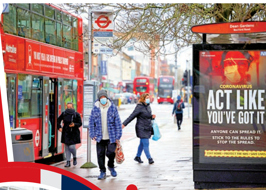
▲英國疫情嚴峻，倫敦民衆2日戴口罩出行。