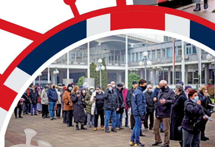
▲塞爾維亞民衆2日排隊等候接種中國疫苗。

與此同時，歐盟與英國的「疫苗貿易戰」仍未平息，遲遲無法得到疫苗的巴爾幹諸國深感失望，黑山和北馬其頓已宣布將從中國和俄羅斯購買疫苗。北馬其頓官員坦言，該國曾希望購買西方疫苗以表忠心，最初完全沒有考慮到與中俄商談購買的可能性，但「鑒於匈牙利等歐洲國家正採用國藥疫苗，我們很難向民眾解釋為何要苦等輝瑞、莫德納和阿斯利康。」