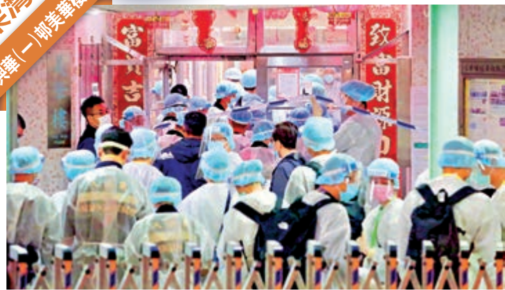
▲警員在美華樓外拉起封鎖線，受檢人士須在凌晨二時前檢測，目標今晨約七時完成。