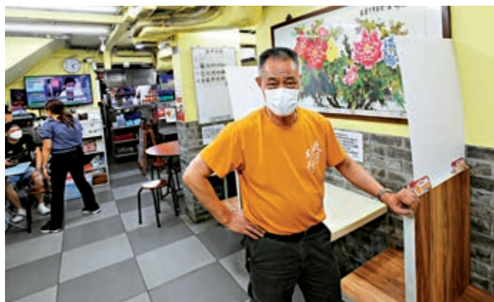
▲明哥支持封區檢測，認為有助找出無病徵隱形傳播者，呼籲大家配合檢測。