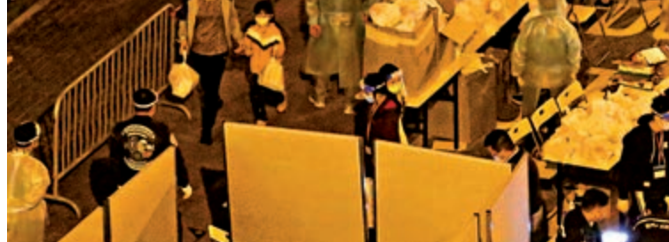
▲市民帶同小朋友落樓做完檢測後領取食物包。