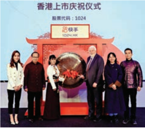
▲六位快手用戶在雲上市儀式上敲鑼。