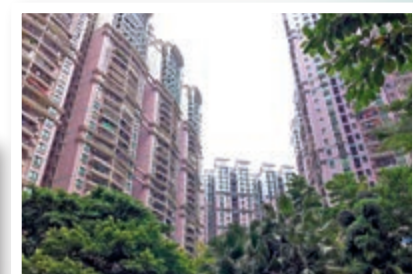
▲荔港南灣接近中山八路商圍，可步行至地鐵5號線西場站。