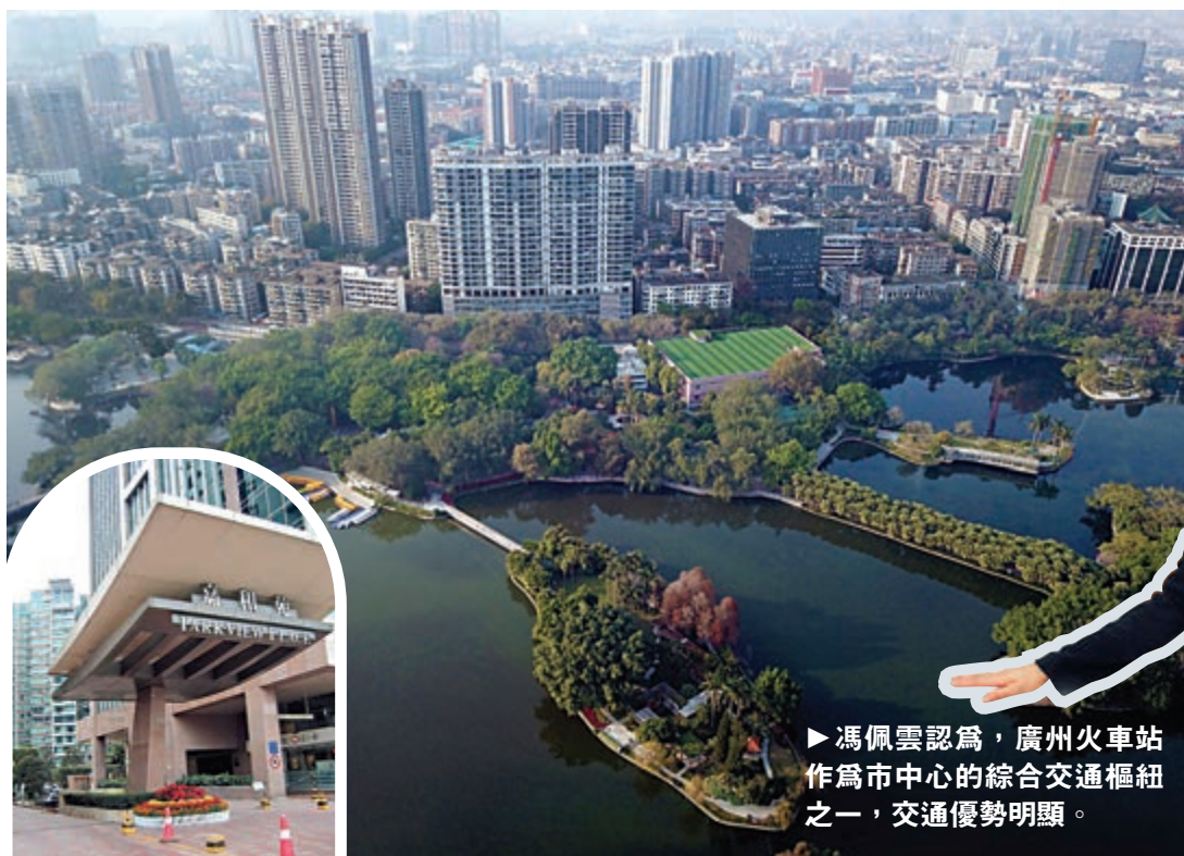
▲廣州火車站附近有流花湖公園，而旁邊就是嘉和苑。

記者走訪發現，廣州火車站附近有馳名的中國大酒店，這是老廣州人曾經最引以為豪的酒店；而在不遠處又有近60年歷史的東方賓館。這裏覆蓋主打外貿的流花商圈與主打批發的火車站商圈，所以