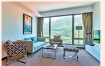
▲愉景灣酒店的家庭式新春Staycation，可在山景單臥室套房住宿一晚。