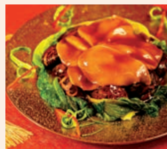
▲Novotel鮑螺片冬菇扒生菜。