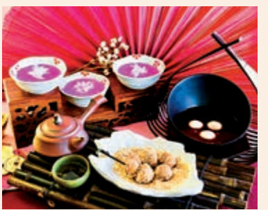
▲愉景灣酒店椰汁年糕不用。