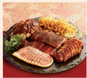
▲帝京酒店金豬五彩錦繡盤。