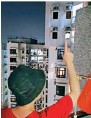
▲杏花邨居民李女士表示，因樓層地板較薄，特別應聲。