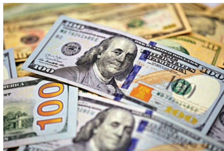
外國投資者包括政府央行連續五個月減持美債。

歐美經濟反彈，大宗商品價格持續走高，油價與銅價分別上升13個月與八年高位，尤其是近日美國受累極端嚴寒天氣而影響三分之一原油產能，汽油價格應聲上揚，導致美國通脹呈現升溫壓力，進一步增添債價下跌、債息上升的壓力。在經濟未見復甦、通脹觸底回升之下，