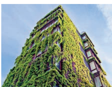
▲新冠疫情之後，全球對環境衛生與可持續發展提升新高度。

沛然環保近期股價急升，目標價先看1元，止蝕0.7元；突破1元後，可將止賺和止蝕位向上移。