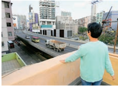
晚間有市民因住近高速公路，飽受引擎聲滋擾之苦。

環保署資料顯示，油尖旺、九龍城及灣仔三個人口密集地區，受過量交通噪音滋擾的人口比例均超過20%，其中油尖旺區最多居民受影響，多達24%，即相當於每四人有一人受影響，其次是九龍城區有21.4%，以及灣仔區有21%。另外，以暴露於超過70分貝環境下的人數計算，觀塘區是最多人飽受噪音滋擾之苦，有9.8萬人，其次是九龍城有8.6萬人。