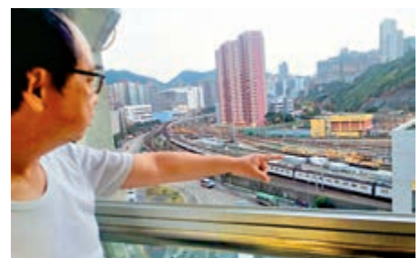
▲梁先生表示，為了減低車廠的噪音，他在露台加裝窗戶，形成「雙窗」的隔音效果。

坊梁先生，因為單位面向柴灣車廠，深受列車進出的噪音滋擾，他指車廠幾乎整天都發出噪音，尤其清晨列車駛離車廠時的高頻聲音「特別尖」，擾人清夢。雖然單位設有令人羨慕的露台，但梁先生無奈表示，一旦打開落地玻璃門就「嘈到拆天」，所以就算是冬天大部分時間都是關門閉窗。