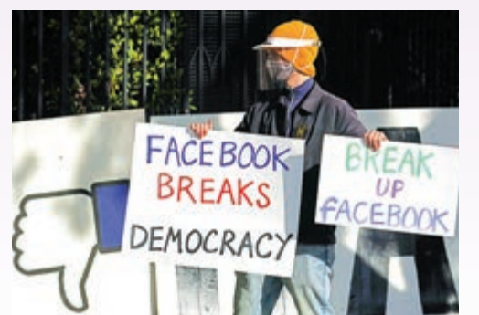
▲去年11月，美國示威者在朱克伯格住所外抗議Fb傳謠。

中國香港反修例風波期間，Fb等平台亦縱容「黃絲」造謠傳謠，並為他們打造「同溫層」，令他們愈發狹隘和偏激。包括香港在內，各地社會都必須認清科企及其背後資本帶來的危險，不能放任他們操控輿論、撕裂社會。