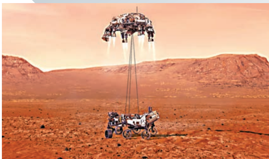
▲NASA放出「毅力號」登陸火星示意圖。