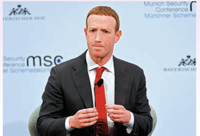
▲Fb創始人朱克伯格面對愈來愈大的反壟斷壓力。