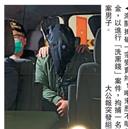
▲海關揭破一宗變賣約1噸來歷不明黃金，以進行「洗黑錢」案件，拘捕一名涉案男子。大公報突發組攝。

海關提醒運輸業界，在運送物品尤其是高價值物品如黃金和貴金屬時，必須多加留意，並了解該物品來歷，亦不要隨便使用自己的銀行戶口處理不明來