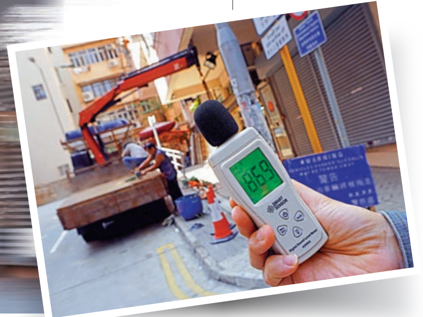
▼記者在錦屏街檢測，噪音持續超過80分貝，有時更達到約100分貝。