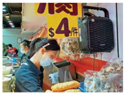
◀大光里有不少檔販為吸客，在店內外裝了多部揚聲器播放資訊，產生大量噪音。

兩旁約20多間店舖的通道，已有四間店舖在門外如帳篷底、收銀機旁等不同位置擺放揚聲器。有凍肉店直接將約一呎乘呎半大揚聲器，擺放在向街櫃枱上並將音量調至最大，一邊不停播放賀年歌外，一邊重複播放店內特價資訊，完全沒理會街坊感受。