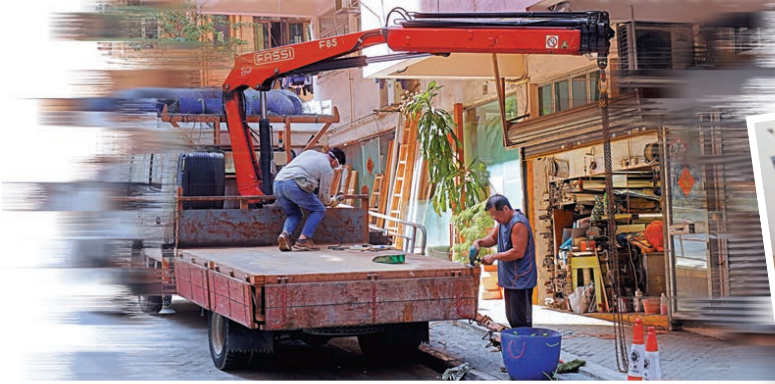
◀工人為貨車打磨除鏽，噪音刺耳、塵埃飛揚。