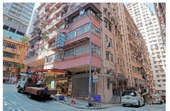
▲錦屏街一帶至少有十間經營小型工程店舖及五金舖，而樓上是民居，人口稠密。

噪音是導致聽力喪失的主要元兇，有專家指出，一般人以為因職業及工種關係才會令聽力受損，但事實上，在日常生活中如飛機、汽車、街市及商舖等「恆常噪音」，使人不自覺地喪失不同程度的聽力而不自知，一旦耳朵感覺器官的細胞受到傷害，將永難復原；另噪音還會提高人體內皮質醇的分泌，進而引致高血壓、心臟病和胃潰瘍，並影響心血管的健康、睡眠的品質，甚至胎兒的發育。