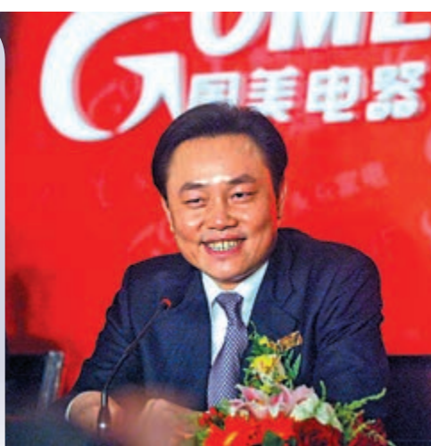
▲黃光裕獲釋後，在國美高管會議上發表講話。資料圖片