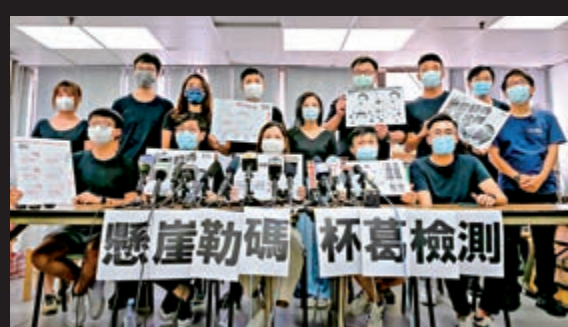
▲去年「醫員陣線」無理呼籲市民杯葛「普及社區檢測計劃」。