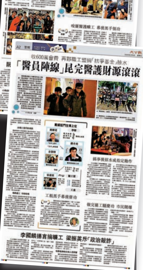
▲大公報去年初曾多次揭露「黃絲」工會「醫員陣線」於黑暴期間搞事，以及工會高層的醜態。

因應第四波疫情緩和，政府前日起對食肆堂食「鬆綁」，但要求顧客必須掃描「安心出行」二維碼或登記個人資料。黃絲工會「醫員陣線」無視新冠肺炎疫情隨時反撲，與政府的防疫抗疫政策「打對台」，連日來在社交平台發帖散播謠言，造謠抹黑「安心出行」程式是政府用於監控全港市民，前日下午更在旺角擺街站及派傳單，並聲稱未來幾日會在各區以同樣方式，呼籲市民杯葛「安心出行」。