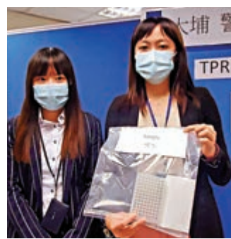
▲警方展示涉事樣本器皿，分為多格可同時盛載多個深喉唾液樣本。

【大公報訊】記者黃浩輝報道：負責營運多個社區檢測中心的私營機構華大基因，一月底至二月初經衛生署覆檢其中三天的檢測樣本個案後，發現有16宗呈假陽性個案，出錯原因包括人為錯誤及試劑污染。華大前日報警，經翻查閉路電視後，警方拘捕一名華大基因化驗室男助理，指他疑先後三次故意搖晃深喉唾液樣本，破壞及影響檢測結果。