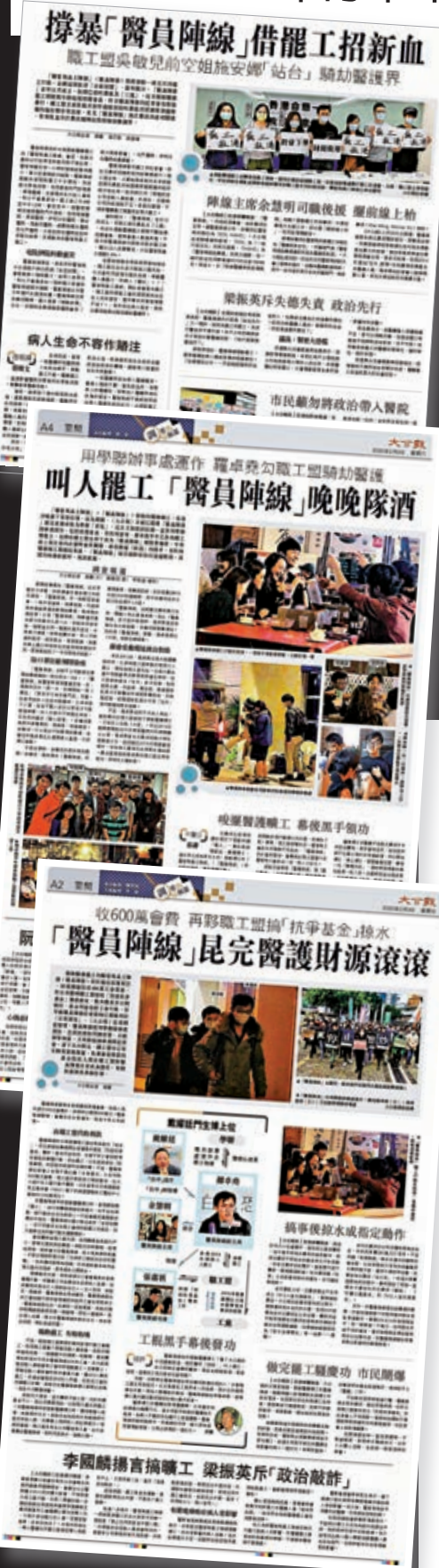
▲大公報去年初曾多次揭露「黃絲」工會「醫員陣線」於黑暴期間搞事，以及工會高層的醜態。