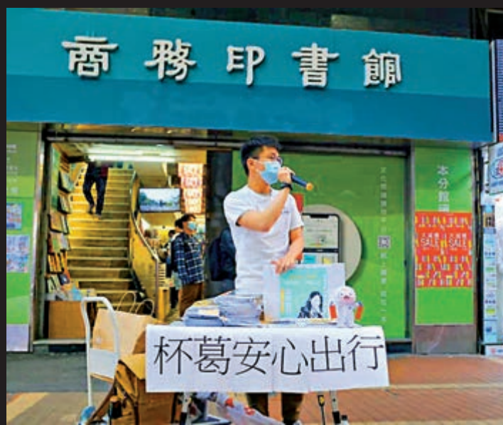
▲「醫員陣線」前日在旺角擺街站，呼籲市民杯葛使用「安心出行」程式。