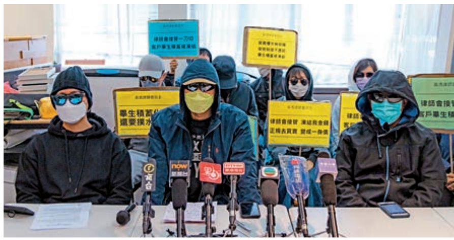
部分苦主對高院不受理黃馮合夥人覆核律師會接管感到失望。資料圖片