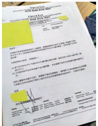
張小姐當年個案的法律文件及法庭判令。