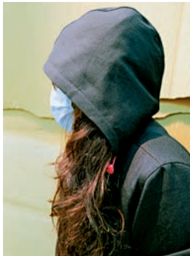
張小姐（化名）大量款項被挪用，只能取回約三分之一款項，而且等足數年才完成程序。