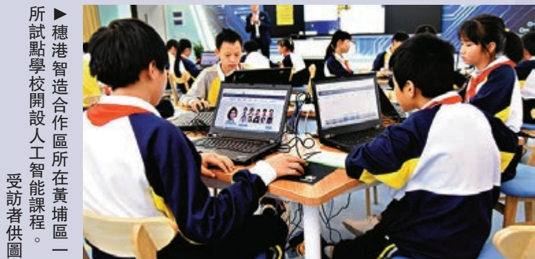
▶穗港智造合作區所在黃埔區一所試點學校開設人工智能課程。受訪者供圖