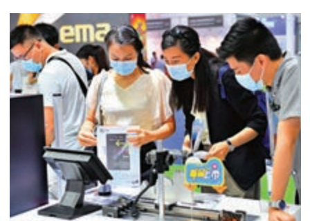
▲智能工廠設備不斷升級，為香港「再工業化」帶來新機遇。

穗港智造合作區的雄心不止於此，其建設任務還包括要「打造國家級開區轉型新標桿」。為此，除了在園區及城區建設項目中試行香港工程建設管理模式。合作區還探索建設粵港澳大灣區勞動爭議聯合調解和速調快裁平台，試點聘任港澳人士擔任勞動人事爭議仲裁員。 國際爭議解決及風險管理協會創會主席、香港和解中心會長羅偉雄博士表示，合作區內吸引不少港企、香港及境外資本參與，相信未來涉及到香港和海外的糾紛也會增加。為此，合作區更需引進有系統的、先進的、有國際經驗的勞動糾紛調解平台。「引進香港仲裁員、調解員，這將提升整個合作區商業投資氛圍，可以促進區域整體營商環境國際化。」