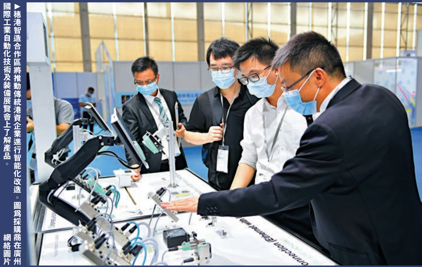
▶穗港智造合作區將推動傳統港資企業進行智能化改造。圖為採購商在廣州國際工業自動化技術及裝備展覽會上了解產品。圖為採購商在廣州網絡圖片