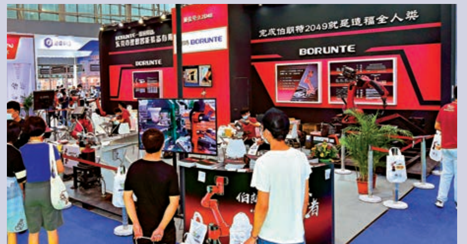
▲穗港智造合作區內企業將進行「機器換人」等轉型升級。圖為廣州一場博覽會展出的高端設備。