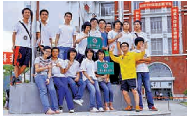
▶南方科技大學部分2011年入學的第一批學生在校園合影留念。