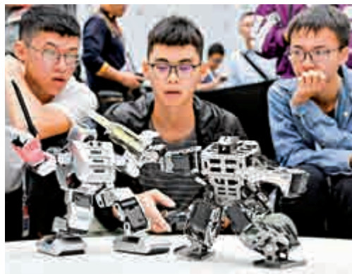
▲廣東學子參加仿人機器人擊劍比賽。資料圖片