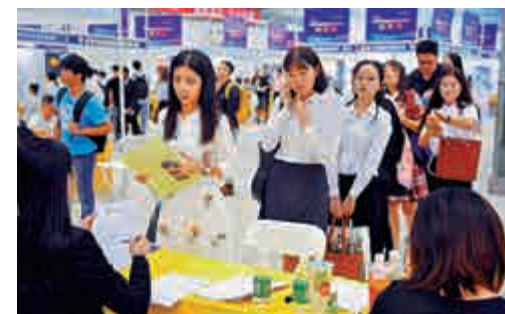
▲2019年全國高校畢業生秋季就業雙選會在深圳舉辦。資料圖片