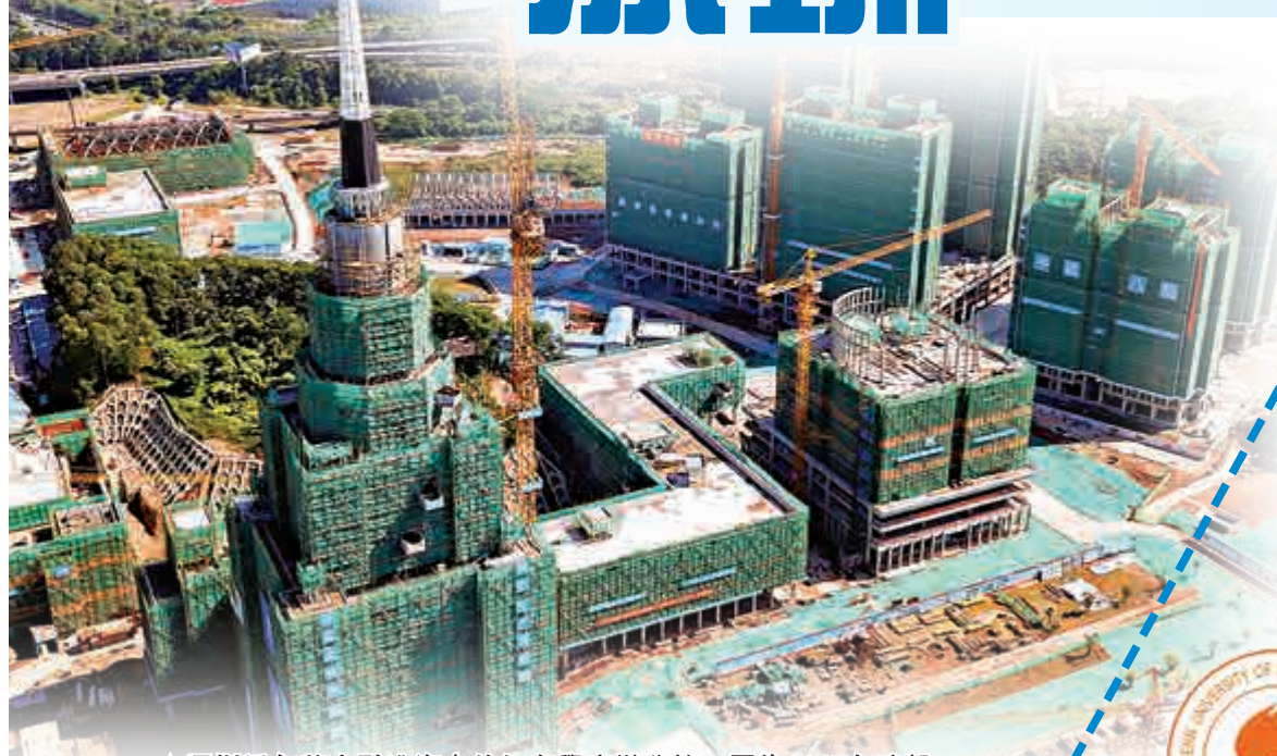
▲深圳近年着力引進海內外知名學府辦分校。圖為2017年建設中的深圳北理莫斯科大学。

作為中國最富庶的省份之一，廣東不但坐擁「北上廣深」四大一線城市之二，而且經濟規模媲美美國、俄羅斯等國。但長久以來，其高等教育水平一直在追落後，難與名校如雲的北京、上海相比。為支撐高質量經濟發展，廣東近年積極補上這方面的短板，除選得海內外名校建設分校，更不惜重金延攬各地人才，建立自家優質教育品牌。大公報今起推出《粵教越優》系列報道，與讀者分享近年來廣東大力發展高等教育的過程與佳績。