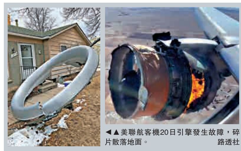
▲美聯航客機20日引擎發生故障，碎片散落地面。

另外，在荷蘭，馬斯赫赫特市警方表示，一架目的地為美國紐約的四引擎波音747-400貨機，20日稍早自當地機場起飛後，其中一個引擎起火，多枚金屬掉到北方城鎮梅爾森地面。