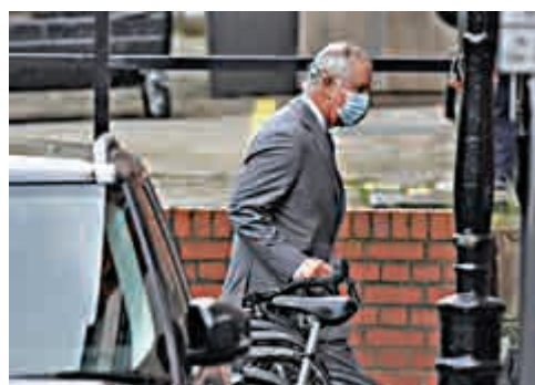
▲王儲查爾斯20日去醫院探望父親。

這次並非菲臘親王近年來首度「預防性入院」，他在2019年12月也曾在國王愛德華七世醫院住院4晚，其後在聖誕節前夕出院，到諾福克郡和女王伊麗莎白二世共度聖誕。