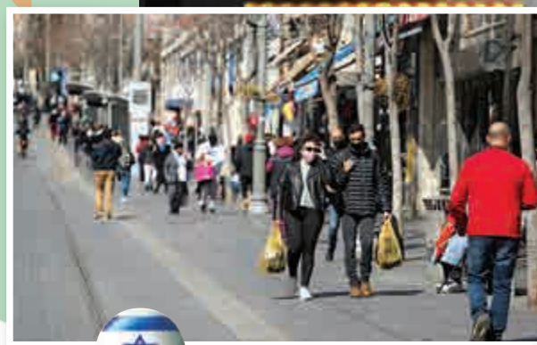
以色列自21日開始解封。