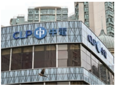
▲中電表示,會留意相關燃料價格走勢,並盡量降低電費波幅對市民影響。