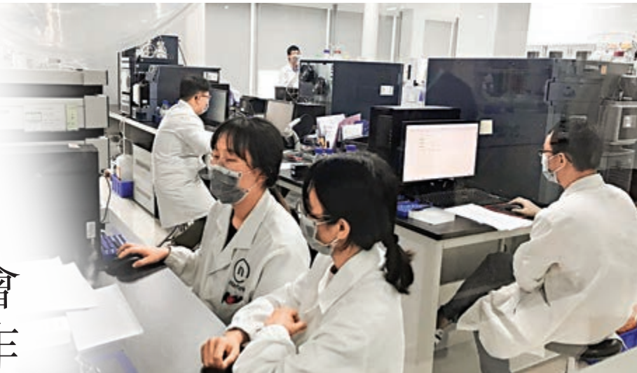
►香港高校紛紛北上開設分校。圖為大灣區一所高校的學生在做研究。