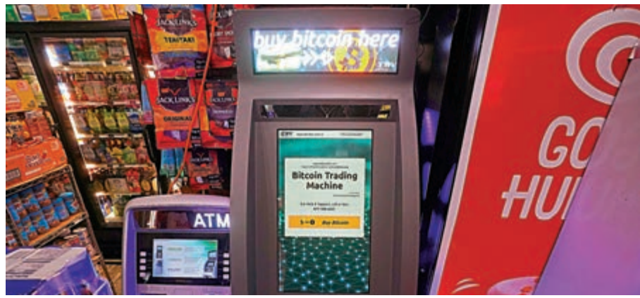
◀ 比特幣將進入技術性熊市，呈現泡沫爆破的信號。

美國財長耶倫終於忍不住發聲，關注比特幣瘋漲，警告投資者比特幣具有高度投機性，似乎暗示可能出手干預，比特幣單日應聲大跌逾10%，拖累虛擬貨幣如狗狗幣普遍急挫10%至