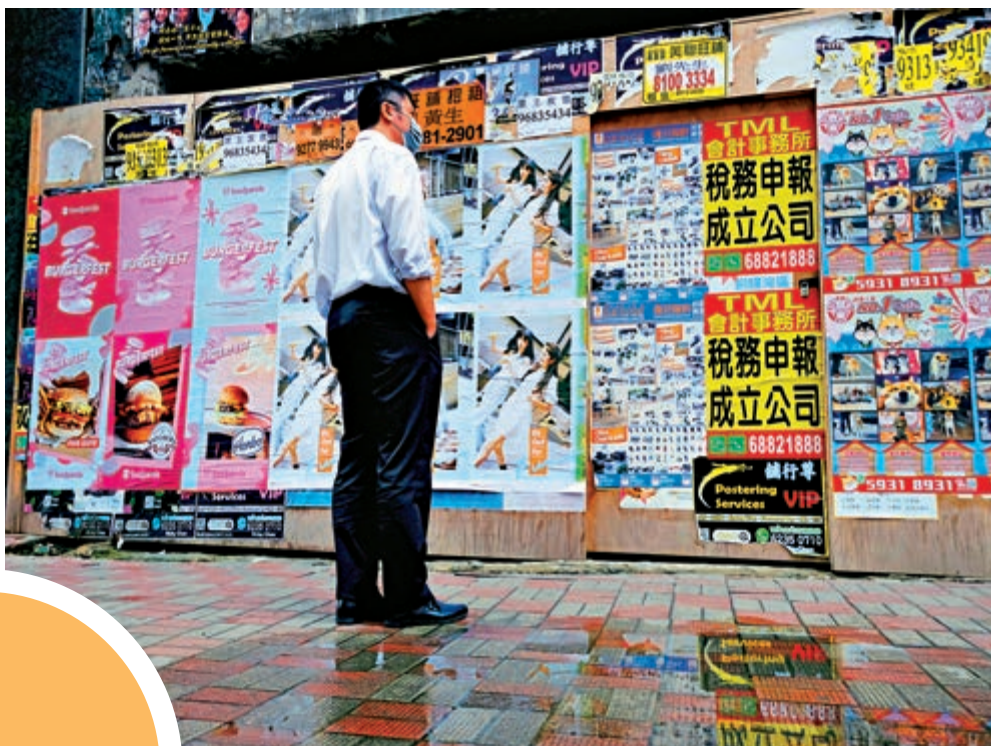
▲預算案提出向失業人士提供「百分百擔保個人特惠貸款計劃」，讓他們在經濟困難時有資金應急。