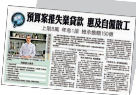
▲《大公報》昨日報道，預算案推失業貸款，惠及自僱人士及散工。