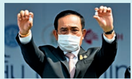
▲2月24日，泰國總理巴育在曼谷素萬那普機場展示中國科興新冠疫苗。

據報道，歐爾班此前在接受電台採訪中預測，由於有使用中國新冠疫苗的計劃，預計五月底之前，匈牙利將比其