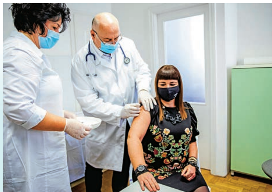
▲2月24日，匈牙利南部塞格德城市一所醫療中心為前線醫護接種國藥新冠疫苗。

目前，中國還有一款重組蛋白新冠疫苗正在Ⅲ期臨床階段。陶黎納預計，未來中國主流新冠疫苗應包括滅活、腺病毒載體和重組蛋白三種技術路線，屆時可評估綜合性能再重點發展，這將成為中國疫情防控的獨有優勢。