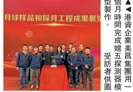
▲港資企業美昌集團用一個月時間完成嫦娥五號探測器模型製作。