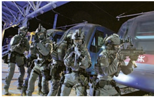
▶《拆彈專家2》製作費超過2億港元，最難是拍出故事的真實性，令觀眾信服。