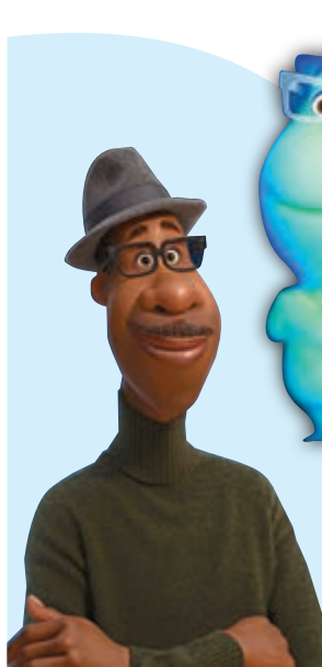
◀主人公Joe有音樂夢想，卻在平淡的生活中奔忙。他意外死去靈魂出竅，想盡辦法要回到人世。

上週四（2月18日）香港戲院重開，彼思動畫製作室（Pixar）新片《靈魂奇遇記》（Soul，又譯《心靈奇旅》）遲到了兩個月，終於和香港觀眾見面。在新冠肺炎疫情洗劫世界一年之後，一個人在戲院安安靜靜看這樣一部追問生命意義的電影，雖對於一些人而言只是一碗雞湯，倒也不妨一飲，暖暖身子。