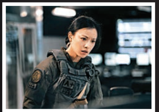
▲內地女星倪妮在《拆彈專家2》變身反恐特勤隊總督察龐玲。