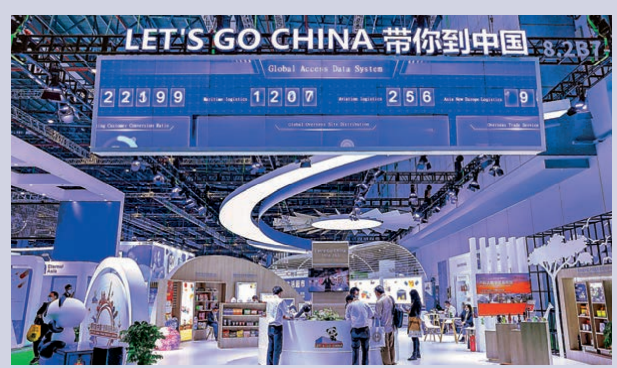
華南美國商會最新調查顯示，94%受訪美資企業對今年中國經濟前景持樂觀態度。圖為去年進博會上服務貿易展區。

然而，華南地區自貿區近年來對投資者吸引力在下降，僅約四分之一企業表示對華南地區自貿區投資感興趣，儘管企業依然認可華南地區發展的市場增長潛力，以及毗鄰港澳地區的優勢，但運營成本和人力資源成本不斷上升、缺少合格的人才，仍是企業在華南地區發展所面臨的挑戰。