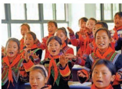
▲在易地扶貧搬遷政策下，不少孩子從深山搬到了方便上學的新居，得以追逐心中的夢想。新華社

【大公報訊】綜合新華社、中通社報道：中共中央總書記、國家主席、中央軍委主席習近平25日宣布，中國脫貧