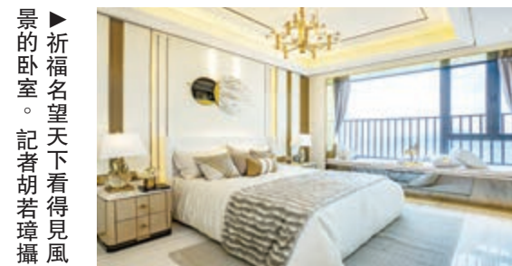
祈福名望天下看得見風景。