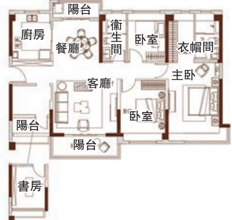
圖為碧桂園藏瓏府140平方米，三室兩廳一廚戶型圖。