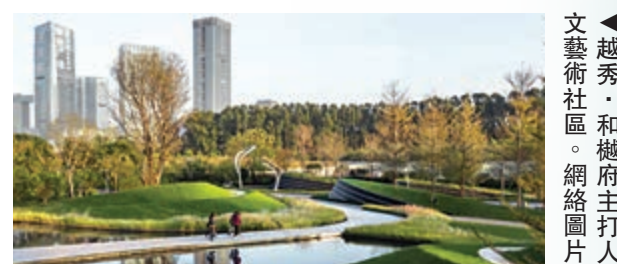
越秀·和樾府主人文藝術社區。網絡圖片