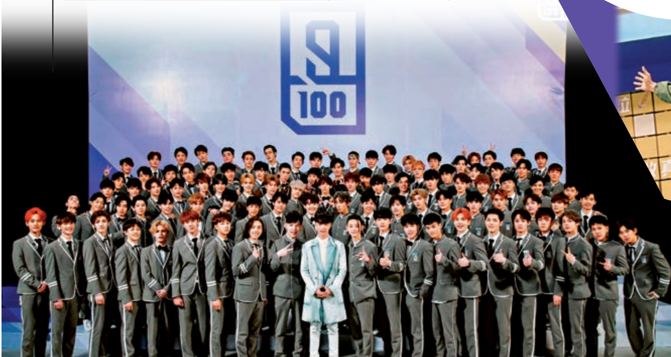
◀二〇一八年的《偶像練習生》，主辦方落力經營參選者的偶像形象。