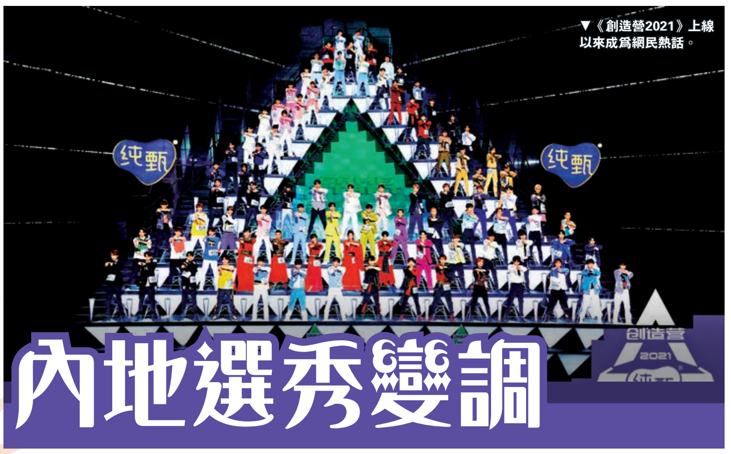
▼《創造營2021》上線以來成為網民熱話。