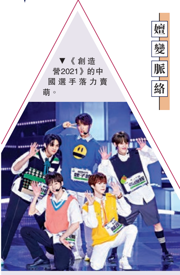
▼《創造營2021》的中國選手落力賣萌。