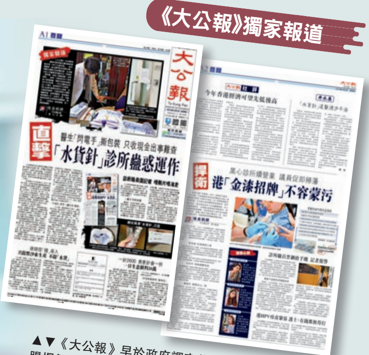
▲▼《大公報》早於政府調查前已以系列形式獨家踢爆假HPV疫苗，引起兩地民衆廣泛關注，更憑藉此系列一舉拿下兩項重要新聞大獎。