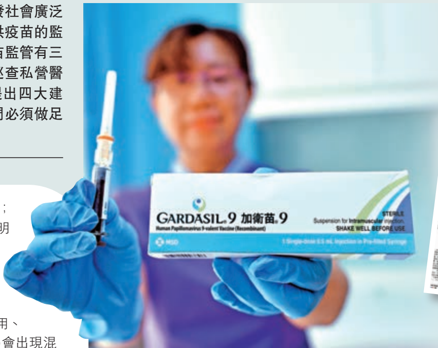
▲前年本港有醫務中心提供冒牌九價HPV疫苗接種，事件被《大公報》揭露後，引起廣泛反響。

《大公報》在2019年率先揭發水貨HPV疫苗襲港，連串報道引發社會廣泛關注，在內地及香港有逾億的網上點擊率，大批苦主來港追查情況，要求退款；相關診所及公司先後搬遷或結業，有關人士被追究法律責任，同時令香港各大媒體爭相跟隨報道。《大公報》更憑藉「HPV疫苗陷阱」獨家報道系列一舉拿下「香港報業公會最佳新聞獎」的「最佳獨家新聞」和「最佳新聞報道」兩項重要大獎。