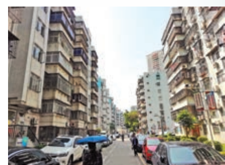
▲鵬灣花園一村性價比高，又有舊改概念。

鵬灣花園一村正在推進舊改，因此具升值空間和吸引力。2019年該小區已啟動棚改項目的街道交流，鵬灣社區鵬灣花園一村棚改工作也在積極推進當中。樓盤鄰近地鐵站、沙頭角口岸和壹海城等，未來舊改完成後，新房價至少在7萬元以上，現時買入的業主未來至少是1比1.1的賠付，無疑帶來較好性價比升值空間。