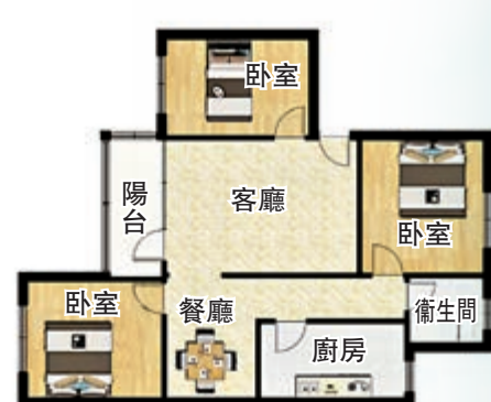
▲鵬灣花園一村88平米三房兩廳。