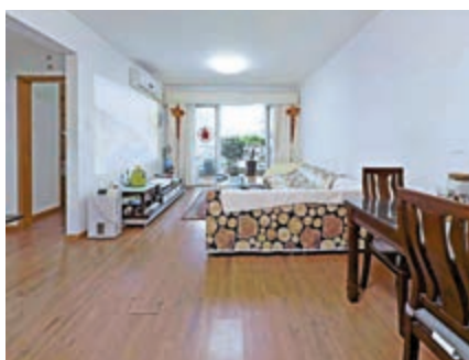
▲東埔海景花園戶型方正，實用率高。