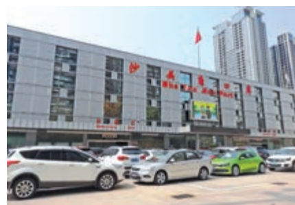
▲沙頭角口岸擬進行改造升級，未來客流將大增。