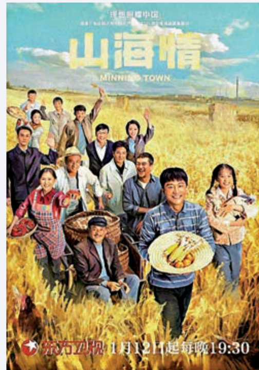
▲劇中描述的貧困、艱苦、荒涼對城市人來說可能難以相信，但卻是曾經真實地發生過。

香港回歸以來，特區政府和不少團體已積極推動香港青年認識國家，但收效一直甚微，這當中有複雜的原因，但直觀的效果就是沒有建立很好的國民身份認同。缺乏國家身份認同的港青，不知道國家如何走到今天，不知道同胞走過哪些艱苦的路才有今天的舒適，也就無法體會今天國家對發展的執著，無法感受同胞對國家的熱愛。