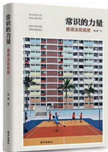
▲香港及內地青年人應該透過理性思考、加強合作交流，真正讀懂香港。

《常識的力量：香港法政觀察》（新華出版社，二〇一八年）是一本以內地青年法律人視角看香港法政及社會問題的觀察錄。作者胡健是一位八十後的香港大學普通法碩士、清華大學憲法與行政法學專業博士，在全國人大常委會法制工作委員會供職。胡健在公派留學香港期間，近距離接觸香港特區立法會、高等法院、廉政公署等機構實習，以法律專業視角結合觀察思考，為讀懂香港立法、司法和行政制度的運行提供了新視角。