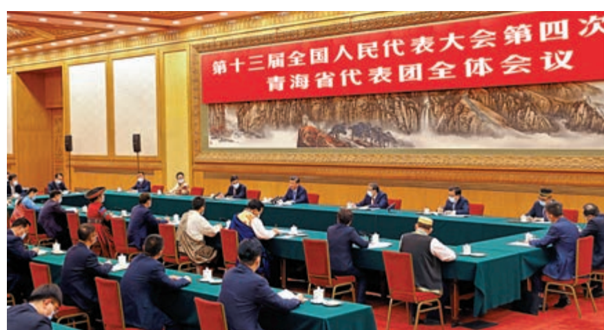
▲3月7日，習近平參加青海代表團審議。新華社