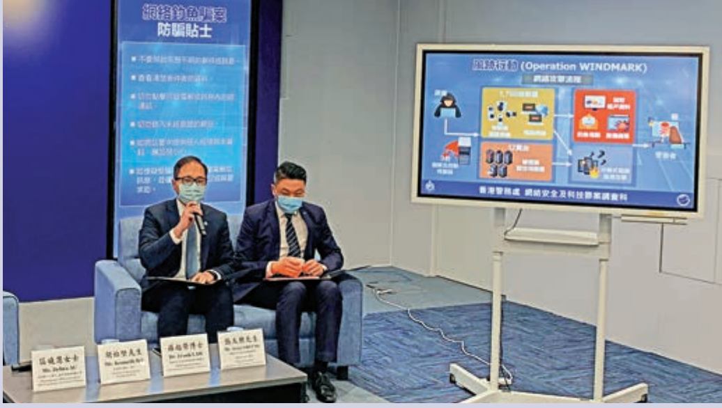
▲警方網罪科聯同香港郵政及香港銀行公會代表，講述近期發現多宗假冒香港郵政和假冒銀行的騙案詳情。

警方網絡安全及科技罪案調查科總警司羅越榮博士表示，在疫情下，市民無論在生活及工作上使用網絡次數增加，根據香港電腦保安事故協調中心（HKCERT）資料，涉及網絡釣魚攻擊的事故，由2019年的2587宗，升至2020年的3483宗，按年急增35%。 針對殭屍網絡及釣魚攻擊，網罪科於去年10月至本月初，主動與不同持份者收集情報，過去一星期（1日至6日）採取風跡行動，打擊寄存在香港的指揮及控制伺服器（C2 server）、協助發動DDoS攻擊的殭屍電腦及釣魚網站。