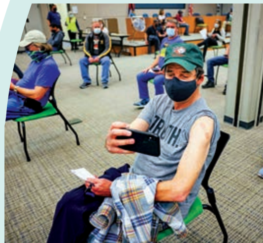
▲科羅拉多州民眾6日接種強生疫苗後自拍。