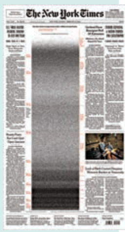
▲《紐約時報》2月21日頭版悼念美國50萬新冠死者。