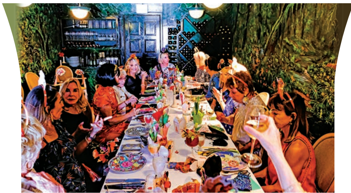
▲5日，美國佛州一群長者接種疫苗數周後舉辦室內午餐會。

【大公報訊】綜合《紐約時報》、美聯社、《華爾街日報》報道：美國疾病控制和預防中心（CDC）8日發布新指引，在沒有新冠病毒重症風險的前提下，已完整接種疫苗的民眾在室內可免戴口罩與未接種者接觸，這是該國對生活恢復常態的首次重要嘗試。CDC亦提醒，即使接種疫苗，仍有再度被感染或傳播病毒的風險，應繼續避免非必要旅行，並在公眾場所戴口罩。