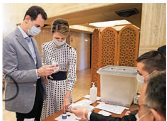
▲去年7月議會選舉中，敘利亞總統巴沙爾和妻子前往票站投票。

敘政府自3月初起展開疫苗接種計劃，一線醫護優先，接下來將對55歲以上人群、尤其是慢性病患者實施自願接種。另外，世衛COVAX計劃正在政府與非政府控制區域上部署疫苗小組，最快將於4月份為當地民眾接種，計劃初步覆蓋2000萬人口中至少3%，並爭取在今年年底達到20%。