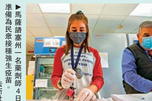
►馬薩諸塞州一名藥劑師4日準備為民眾接種強生疫苗。

CDC將「完整接種疫苗者」定義為打完第二劑莫德納或輝瑞疫苗滿兩周，或打完強生單劑疫苗滿兩周的群體。該中心周一首次針對疫苗接種者放棄防疫措施指，同是完整接種新冠疫苗的人，在室內可不戴口罩見面。