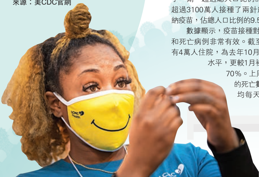
►新奧爾良一名醫護人員4日準備為民眾接種疫苗。