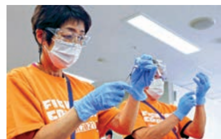
▲京都宇治德洲會醫院護士8日用胰島素針筒抽取7劑輝瑞疫苗。

《日本時報》指出，日本政府與輝瑞簽署了1.44億劑供應合同，打算今年內為國內一半以上人口接種。但政府擔憂輝瑞在比利時工廠的生產延誤，以及歐盟的疫苗出口管制，更換注射器可能加快該國疫苗推廣。