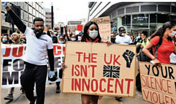
▲英國示威者去年6月在倫敦參加反種族主義示威。