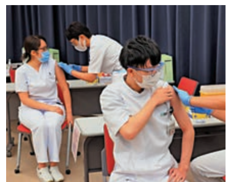
▲日本醫護人員5日接種輝瑞疫苗。

【大公報訊】綜合日本放送協會、共同社報道：日本有多人接種新冠疫苗後出現嚴重過敏。負責疫苗注射計劃的