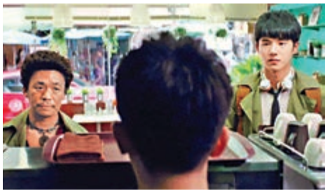
▲《唐人街探案》二〇一五年上映，收穫票房與口碑。