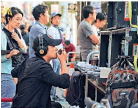
▲導演陳思誠（前）調度大場面的功力，越趨成熟。