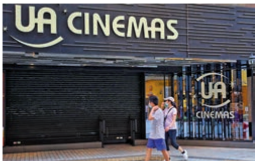
▲UA院線結業反映如今經營戲院不容易。資料圖片

其實去年全球影業都陷入困境，回顧二〇二〇年的香港票房，全年收五億一千六百二十七萬港元，只有二〇一九年的百分之二十七點八，即是下跌了百分之七十二，全年票房榜排名，《TENET天能》以五千五百萬元排第一位。自年初七戲院重開後，因入座人數限制，票房只能逐步回穩，情況相對理想，如UA院線般整條院線結業的情況，希望不要再發生，而這六間戲院理應會被其他院線吸收過去。