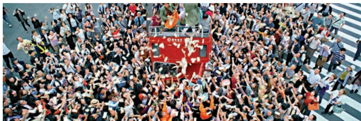
▲《唐人街探案3》在日本街頭拍攝大場面。

然而，《唐探3》所展示的格調，除了國際大製作的群星拱照，場面浩大外，「唐探宇宙」的正邪兩派人物，結合兩集電影及網劇，合組成一個可持續發展的影視IP，秦風父親背後的故事，思諾的身份，以及林默等角色，還有不斷開拓的創作空間，最重要的是三集電影和網劇累積下來的受眾，以及他們對人物的集體記憶，這些都跟當年的賀歲片不可同日而語。作為觀眾，筆者十分期待第四集，毫無懸念，劉德華將是Q的主幹成員，不再只是《唐探3》中，合唱賀年歌作宣傳的大配角。