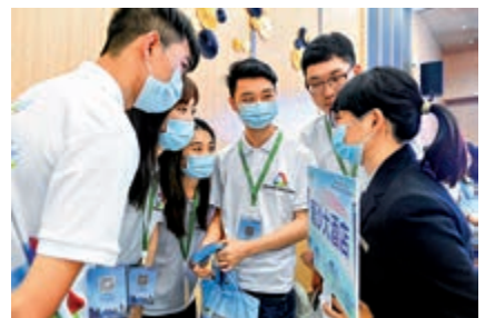
▲港澳青年學生參加南沙「百企千人」實習計劃。

他稱，國家對港澳居民出台了許多優惠政策，也一直鼓勵我們來內地讀書、創業。「希望疫情過後，能有更多的香港學生來內地看看。」尤其是「十四五」規劃出爐後，他認為，這將為未來五年的教育、就業、創業等領域帶來新的機會。「『十四五』是建設社會主義現代化國家的新征程，作為香港居民，我也希望兩岸四地能增強合作和交流，希望香港年輕人能參與其中。」