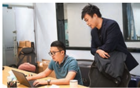
▲內地正不斷為港澳青年提供優質的發展平台。圖為深圳前海深港青年夢工場。

他說：「年輕人要多來內地了解實際情況，拿到律師、會計師等專業資格後，再結合海外經驗，會有很廣闊的發展空間。」