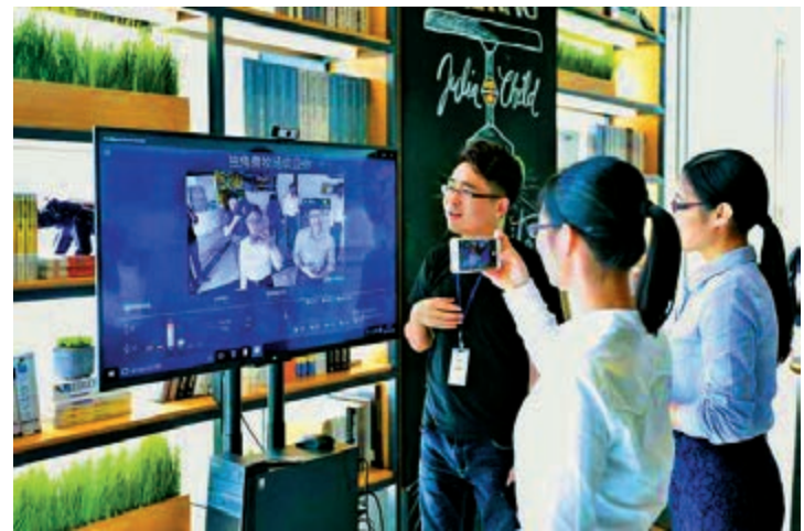
港澳青年在內地創業的大環境，近幾年也在循序漸進地變好。