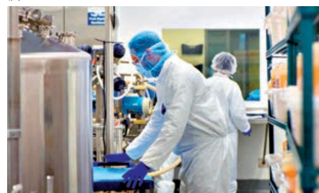
▲美國新興生物科技公司已生產大批阿斯利康疫苗。

為應對藥廠削減供應問題，歐盟11日宣布延長疫苗出口透明度和授權機制到6月底。在此機制下，歐盟本月初阻止了25萬劑阿斯利康疫苗從意大利出口到澳洲。