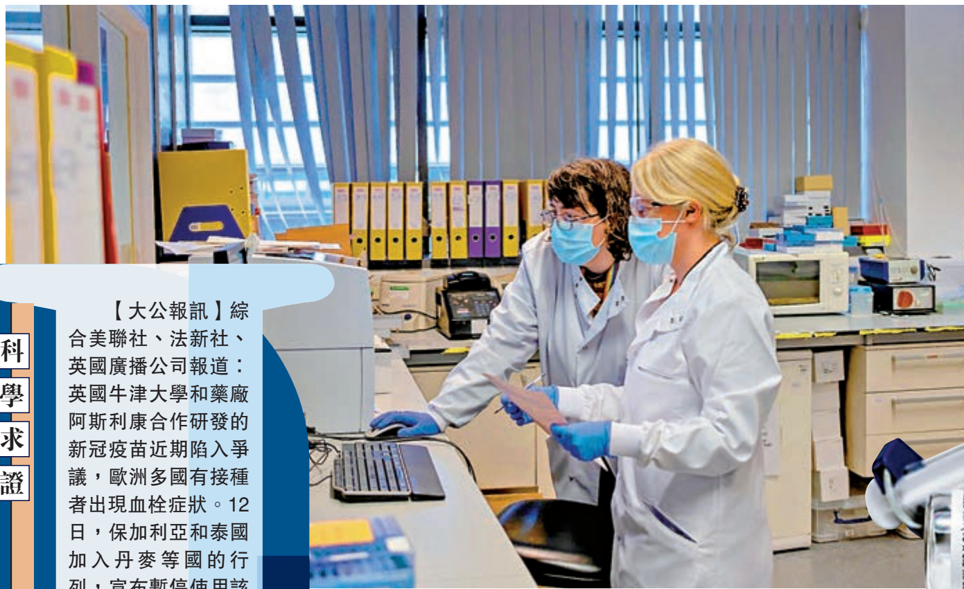
▲牛津大學疫苗團隊去年底在實驗室測試阿斯利康疫苗。