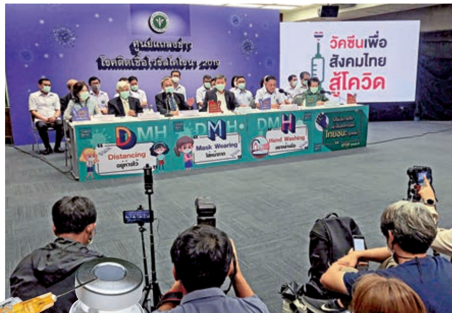
▲泰國衛生官員12日召開記者會，宣布推遲接種計劃。