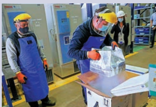
▶智利工人11日將輝瑞疫苗從低溫容器中取出。

輝瑞已招募超過2000名12至15歲兒童進行疫苗測試，預計數月內可公布結果。輝瑞行政總裁布拉11日表示，小學生群體有望在年底獲准接種。