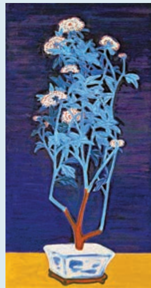
▲常玉對菊花頗為鍾情，圖為《靜月瑩菊》。