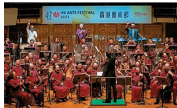
▲陳明志新作《打雀英雄傳》之《又見東風》，四個樂章一氣呵成。