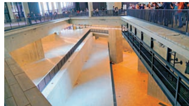
「潛空間」大型展區為在港鐵機場快綫及東涌綫地下鐵路隧道旁開鑿而出，成為博物館與這片土地連繫的象徵。