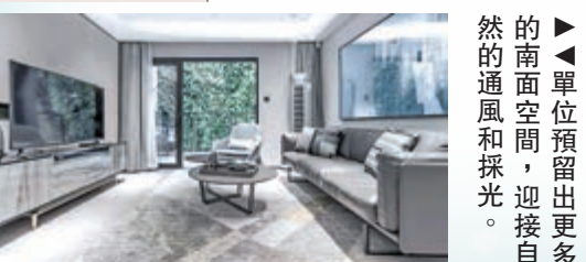
▲單位預留出更多的南面空間，迎接自然的通風和採光。