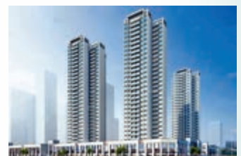
▲時代香樹里屬於小體量樓盤。

據樓盤銷售中介介紹，樓盤去年底才對外開放營銷中心，首期推1至3棟建面約79至108平米的三至四房，約600套住宅，均價每平米3.6至4萬。其中最搶手是87平米三房戶型，由於朝向最好，首期推出的貨量基本搶光。87平米三房戶型，為豎廳設計，方正三房加兩個衛生間，大廳陽台和兩個臥室全南向，沒有多餘浪費的地方，小巧精緻，滿足夫妻小孩和老人一家三代人居住。