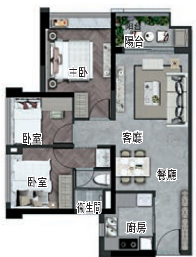
▲星樾·山畔的80平米三房戶型圖。