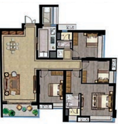
▲龍湖首開·雲峰原著四房兩廳雙陽台的131平米戶型圖。