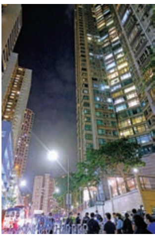
▲政府規定圍封豪宅區居民於今日凌晨二時前完成檢測。

本港昨日新增47宗確診，43宗本地個案中，35宗屬URSUS Fitness健身群組。健身群組累計99名確診患者中，7人是URSUS Fitness的工作人員，75人是顧客，13人是密切接觸者。連同7宗初步確診，URSUS Fitness群組已有106人中招，超越有103名確診患者的酒吧群組，首四日的每日新增確診患者人數，也超越跳舞群組與酒吧群組。