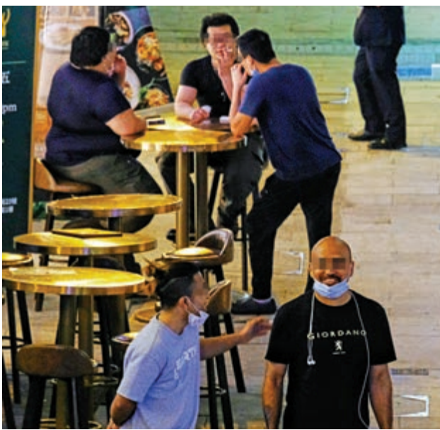
▲中西區疫情升溫，但在中環的酒吧區，市民無戴口罩在街上聊天的情況仍隨處可見。