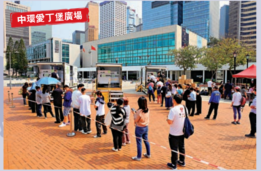
▲中環愛丁堡廣場的流動採樣站，連續兩日大排長龍。