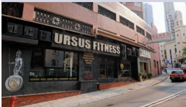
▲西營盤URSUS Fitness健身群組四日中間中招人數破百，傳染速度成爆發群組之最。

政府專家顧問、港大醫學院院長梁卓偉稱，健身群組屬於超級傳播，有患者的暴露史至發病的一至三天內，已傳播了兩、三代，形容相當驚人。中西區多幢大廈驗出污水樣本對新冠病毒呈陽性反應，但未有找出確診者，反映仍有受牽連的群組未浮現，憂慮傳播鏈分布廣泛，涉及中半山、西半山及西營盤一帶，必須透過強制檢測、追蹤密切接觸者等，呼籲相關市民盡快檢測，未有檢測結果不要參加社交活動，否則疫情可能再蔓延。