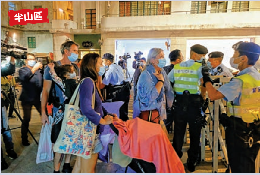
▲政府昨晚圍封雍景臺和殷樺花園，不少外籍居民深夜下樓檢測。