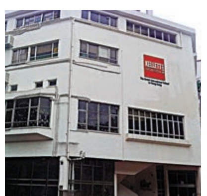
▲薄扶林啟歷學校被列入強檢名單。

衛生防護中心傳染病處主任張竹君昨日在疫情記者會上澄清，中心只向該校發出強制檢測指示，並沒有發出檢疫令。她又透露，中心曾討論應否將學生送往檢疫，但因確診教師除了教書外不多涉及校內