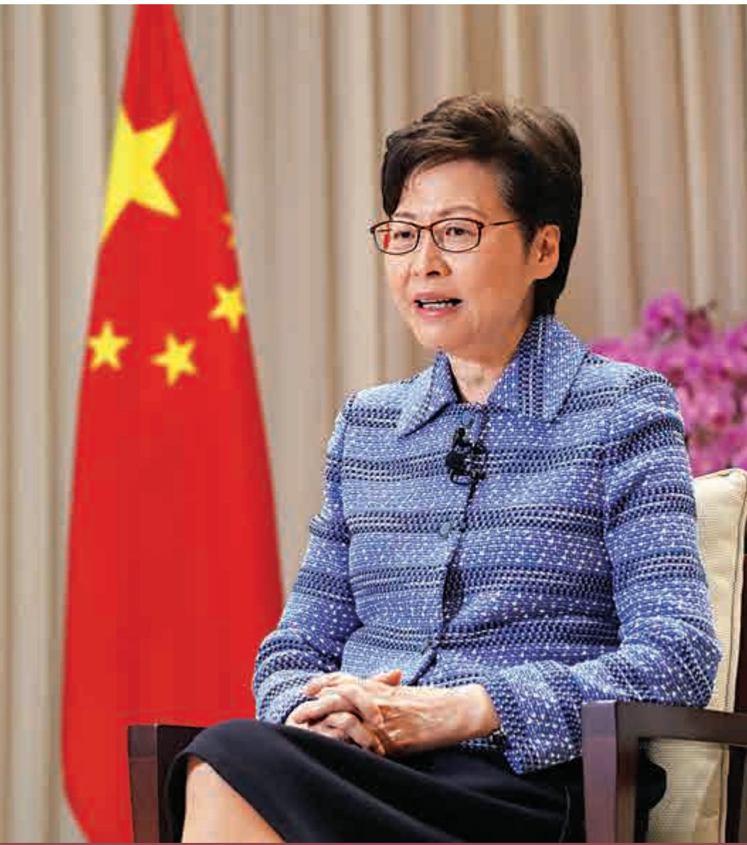
▲行政長官林鄭月娥接受《大公報》專訪時強調，特區政府一定要在未來十二個月內完成本地立法工作及進行三場選舉。