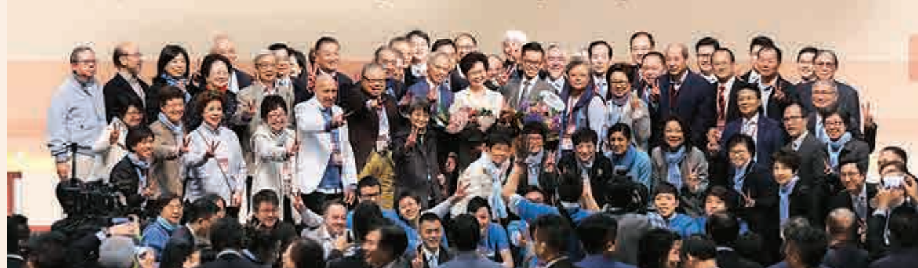
▲林鄭月娥認為，行政長官應具備四大條件。圖為二〇一七年她參加香港行政長官選舉時的活動。