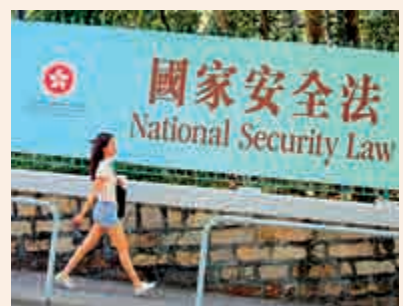
▲香港國安法是定海神針，可以助香港重回發展正軌。

「我們會做好我們的工作，甚至我們都認為，在這個歷史的轉折點，作為僅是香港特區的官員，能夠因為做了保護國家安全的事，因為承擔，而引起個人受到這些影響，可能是一份光榮。」林鄭月娥直言：「相信今次完善選舉制度還會引來個別西方政府採取行動。但我們個人就不會怕了，因為中央是我們最堅強的後盾。」