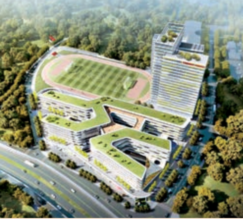
培僑書院信義學校效果圖。