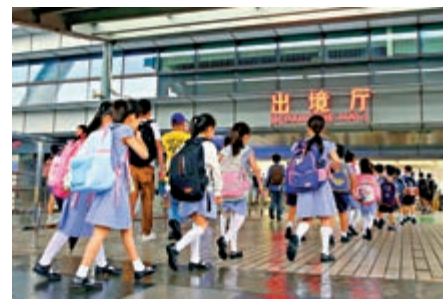
培僑書院信義學校讓內地港生免除奔波之苦。

校，另一方面香港寄宿的中學只有十幾所，根本申請不到學位。」在李先生一籌莫展之際，了解到培僑信義學校的消息，解除了他的後顧之憂。