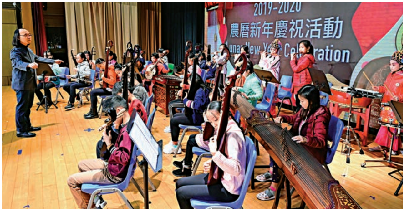
培僑書院信義學校將增設國學等課程，增強香港學子的國家認同感。圖為香港培僑書院學生在慶祝農曆新年活動上表演中樂。

正是因為優異的履歷，培僑書院是香港極少數獲北京大學、清華大學、復旦大學、英國諾丁漢大學邀請作校長推薦的學校之一。據校方負責人表示，只要學生品學兼優，經面試可提早一年獲取錄，經校長推薦升讀以上大學，不用考慮任何公開考試的成績。