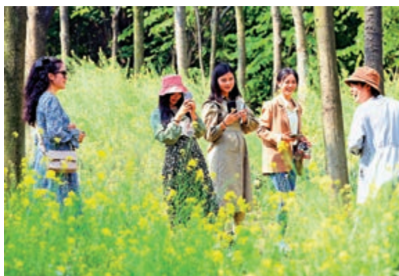
▲3月13日，重慶市渝北區一花園內成片油菜花盛開，吸引遊人。

多。今年的情形遠遠好於去年，從目前機票、度假酒店、租車自駕等旅遊產品的預訂情況來看，清明節的出遊人次有望恢復至2019年同期水平，預計今年清明節出遊人次將達到1億人次。