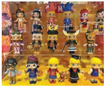
▲盲盒交易是一個千萬級的市場。圖為內地潮流玩具公司泡泡瑪特推出的玩偶。資料圖片

盲盒的二手交易需求充滿機會，千鳥、超級玩童、着魔、盲盒星球、蛋趣、元氣扭蛋、歐啞盲盒等二手潮玩交易平台如雨後春筍般冒出來。用戶可以在上面抽盲盒，抽完APP會顯示娃娃的款式，抽到重複的或不喜歡的可以掛到閒魚上交易。