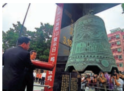
▲第二十屆「中英街3·18警示日」活動現場。