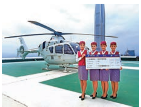
▲工作人員在首航儀式上展示「機票」。

費用方面，由於使用了廣泛用於商務、警務與醫療救援領域的空客135雙引擎直升機，安全得到雙重保障，同時配備專機保障級別雙機長飛行，加上資歷深的維護保障團隊，整體運行成本較高，前期市場費用在人均近5千元（人民幣，下同），後將通過數字化運營平台，實現共享定期航班，加大乘機補貼，整體費用將控制在地面交通的8-10倍左右。「我們希望直升機的出行方式更加普及，希望能依靠數字化平台和科技技術，在2年內實現票價大幅降低，以福田打車至機場百餘元為例，直升機聯票價格約在千元左右。」據趙麒透露，航線後續將開展常態化運營，乘客只需要提前一小時預約飛行即可。