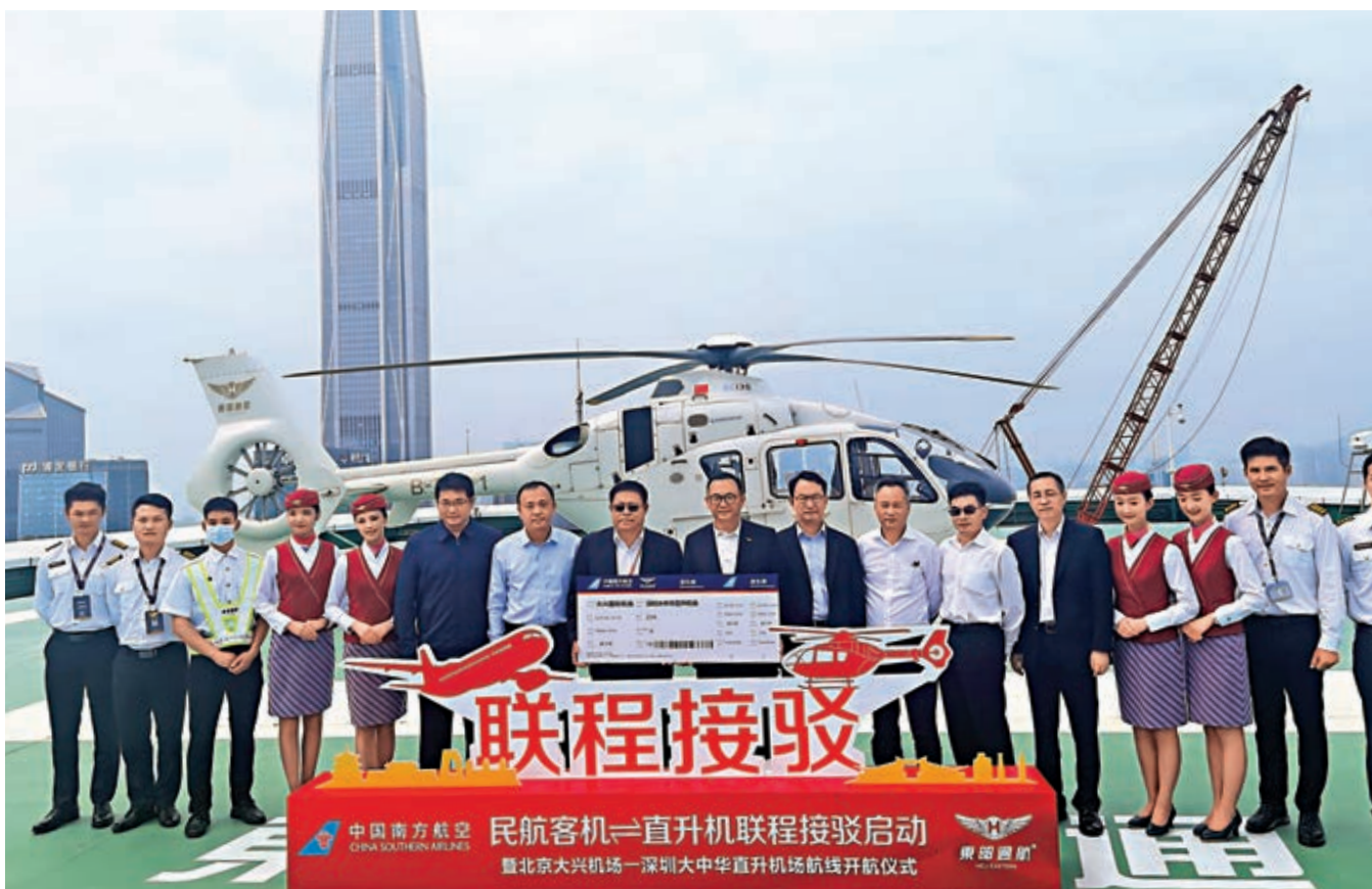
▲內地首條「民航客運+直升機」一站式聯運航線18日在深啓動。