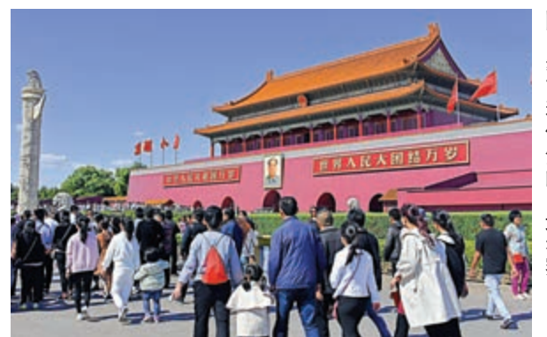
▲工會建議局方提供更多優質的國民教育和優質的內地考察。