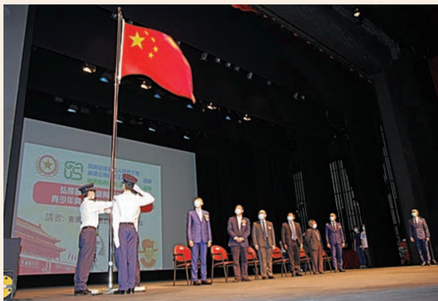
▲公總及紀總日前聯合舉辦國史教育講座，讓更多公務員及學生參與，加深認識國情。