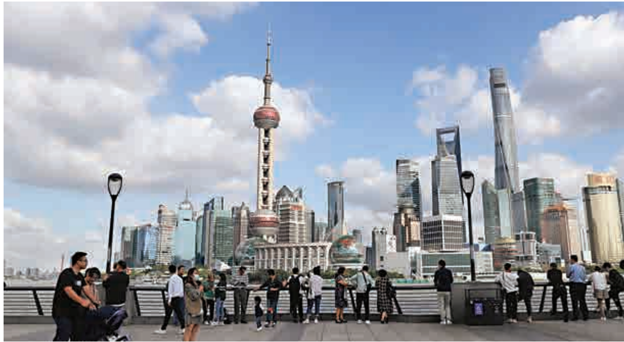
▲2020年，上海、北京、深圳GDP分別為38700.58億元、36102.6億元、27670.24億元，總量在全國主要一、二線城市中居於前三位，增速分別為1.7%、1.2%、3.1%，在疫情衝擊下仍然實現了正增長。